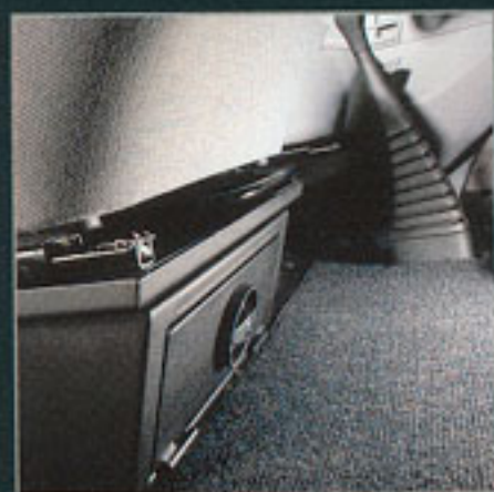
Serienmäßig zwei Wertfächer unter den Vordersitzen

Mit wenigen Handgriffen können die Sitze demontiert werden. Was bleibt, ist 6 m 2 Nutzfläche und damit Platz für die Zuladung von sperrigen Gütern.