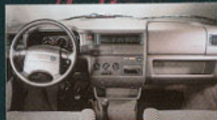
Abbildung mit Sonderausstattung: Klimaanlage und Standheizung

So wird die Fahrt zur reinsten Erholung: Serienmäßig bietet der Profi optimale Beinfreiheit, bequeme Armlehnen und eine gepolsterte Armaturentafel. Ablageflächen in Türen und in der Konsole gewähren viel Platz für wichtige Reise-Utensilien. Für eine angenehme Fahrt sorgt auch die reichhaltige Sonderausstattung. Das Navigationssystem, die Klimaanlage und die Instrumententafel in hochwertiger Wurzelholz-Optik sind Highlights, die die Fahrt im Profi zur Erholung machen.