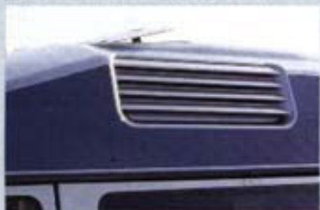
Durch stilistisch gelungene Lamellen können geöffnete Fenster sogar bei Regen für Frischluft sorgen.