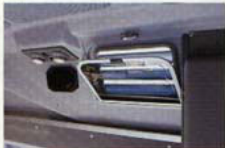
Zugfreie Entlüftung durch die Seitenfenster verhindern den Wärmestau unter dem Wagendach.