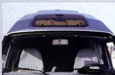
Zwei Sonnendächer sorgen für frischen Wind im PROFI. Ihre Klimakassetten schützen bei zu viel Sonne.

Dabei wirken die gelungenen Verblendungen beider Seiten mit der doppelten Verglasung auch noch temperatur- und schalldämmend. Zudem prägt auch die Keilform des festen Kunststoffdachs nicht nur den Charakter des PROFIS. Sie läßt den Innenraum eine Höhe von 1,86 Metern erreichen und stellt den PROFI mit einem Rekord CW-Wert von nur 0,4 in den Fahrtwind. So weiß der PROFI trotz überraschender Höchstgeschwindigkeit sparsam mit jedem Tropfen Kraftstoff umzugehen.