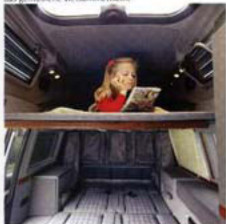
Im geräumigen Hochbett „im ersten Stock“ fühlt sich jeder Snoppe wohl.