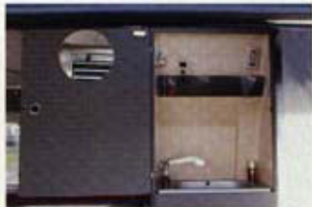
Die Nafzelle weist neben Waschbecken und Dusche sogar eine chemische Toilette auf.