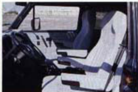
Die Komfortsitze bilden mit ihren Armlehnen auf langen Reisen die Grundlage für entspanntes Fahren.