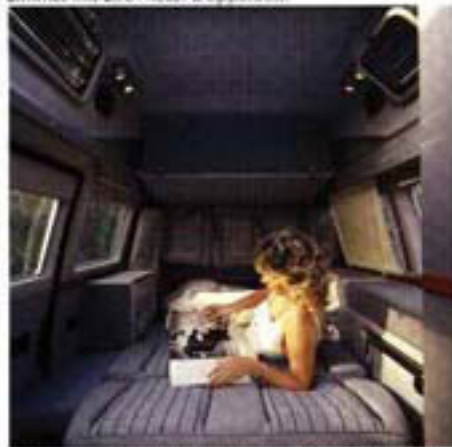
Rollos an den Fenstern schaffen die nötige Verdunkelung und sorgen für optimalen Sichtschutz von außen.