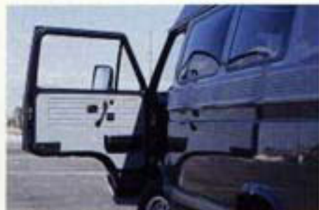
Die Türverkleidungen sind farblich auf Außenlackierung und Sitzpolster abgestimmt.

Was wie Zauberei erscheint ist das Ergebnis ständigen „Denkens in Quadrat-Zentimetern“. Denn wie bei einem Boot, so ist auch bei einem vielseitigen Reisemobil das Raumangebot begrenzt. Allein durch die jahrzehntelange Erfahrung im Bau von Segelyachten und die perfekte Beherrschung moderner Werkstoffe, kann ein Autoinnenraum so vielen Ansprüchen gerecht werden, wie der des DEHLER-PROFI.