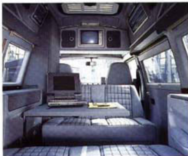
Soll das Management vor Ort entscheiden, ist das PROFI-Büro unersetzlich.