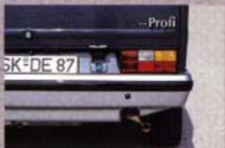
Einmal am Ziel, ist der Profí über den 220-V-Anschluß von der Kapazität seiner Bordbatterien unabhängig.