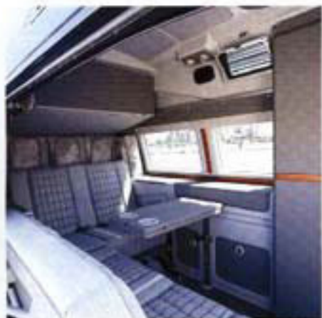
In Wirklichkeit eignen sich die Sitzbänke besonders für das gemütliche Beisammensein.