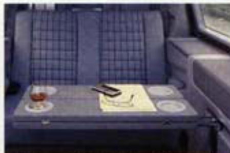
Vielseitig verwendbar – der dreh- und klappbare Tisch dient fast jedem Zweck.