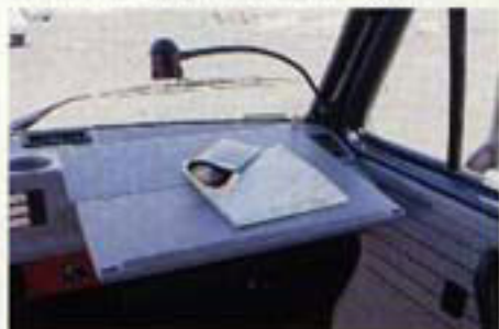
Am Kartentisch studiert der Beifahrer auch nachts wo es lang geht.