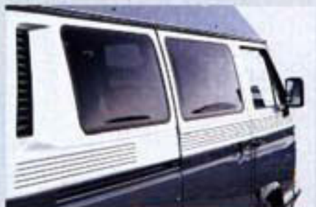
Als Rahmen für die äußere Verglasung bieten elegante Verblendungen besten Schall- und Temperaturschutz.