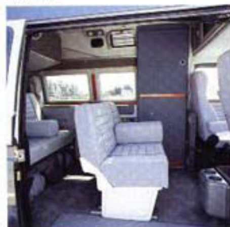
Sechs Passagiere fühlen sich in luxuriöser Atmosphäre sicher und geborgen.