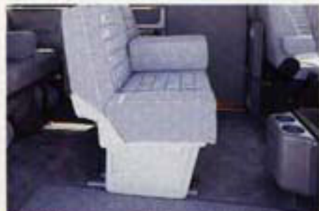
Für PROFÍs ganz normal: ein zum Reinigen knöpfbare Fußabtreter und eine Müllbox mit Einlagebeuteln.