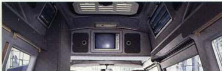
Ein eingebauter Fernseher – auf Wunsch mit Video – dient der Produktinformation oder zur Unterhaltung, nebstbei ist reichlich Platz für Akten und Lektüre.