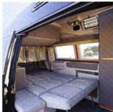
Zur Nacht verwandelt sich der Innenraum zum Schlafzimmer mit 2,10 Meter Doppelbett.