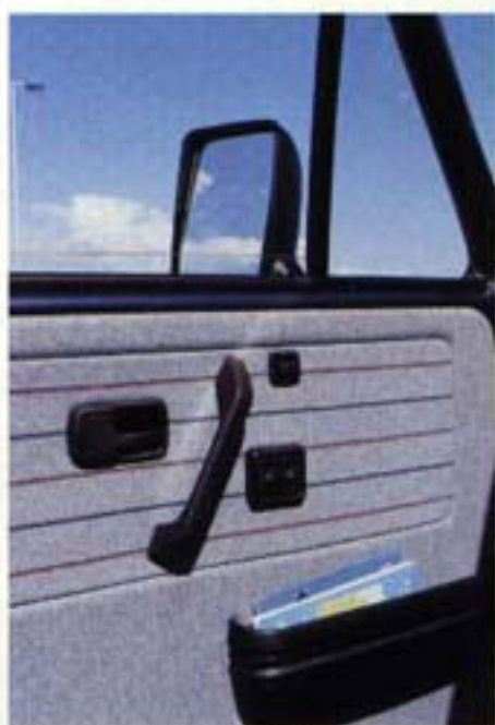
Zentralverriegelung, elektrische Außenspiegel und Fensterheber – im PROFÍ ist nichts unmöglich.