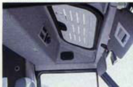
Das Elektropaneel besteht aus der Schaltung der Standheizung sowie Anzeigen für Batterie- und Wasserreserven.