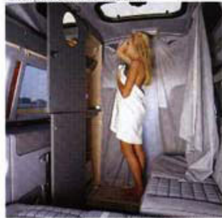
Im Handumdrehen ist eine Duschkabine eingerichtet. So geht es frisch in den neuen Tag.