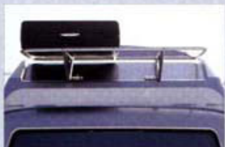
Was innen stört, packt sich der PROFI einfach auf das Dach.