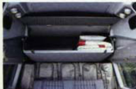
Bleibt das Hochbett zu Haus, dient der Stauraum als Schrank für Bettwäsche oder Aktendorder.