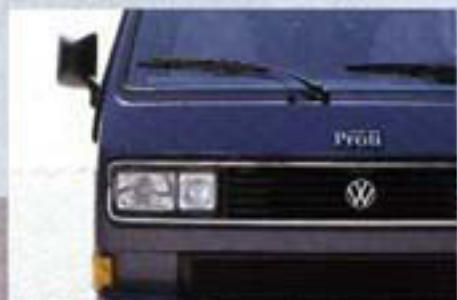
Doppelcheinwerfer garantieren mit hervorragender Lichtausbeute die Sicherheit in der Nacht.