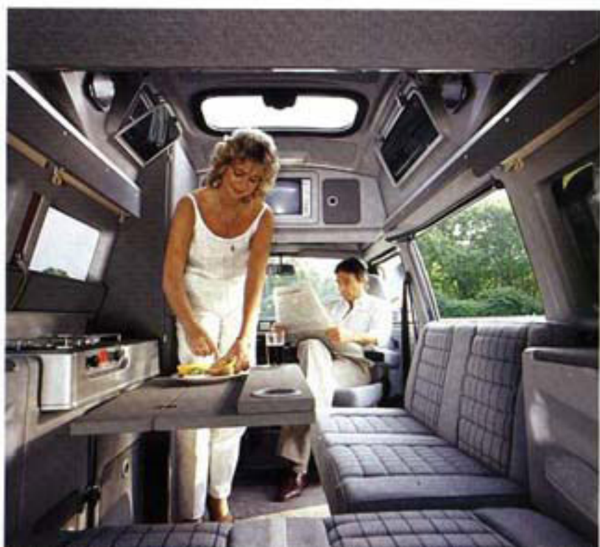
Wird der Beifahrersitz gedreht und die Ecksitzgruppe eingerichtet, zeigt sich der PROFi von der wohnlichen Seite. So sind Sie unabhängig und überall zu Hause.