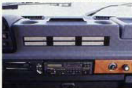
Ablage, Kartentisch, Kassettenfach und Dosenhalter – der Armaturenaufsatz bringt Ordnung ins Cockpit.