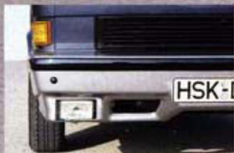
Der DRHLER-Frontspoiler integriert die Nebelscheinwerfer in die harmonische Linie der PROFIS.