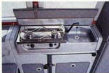
Für das Kalkwasser ist aus dem Seitenschrank mit nur einem Griff eine Küche gezaubert.