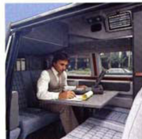
Im Team oder allein – der PROFI bietet den geeigneten Rahmen.