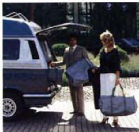
In den auf PROFI-Maße gefertigten Kleidersäcken und Reisetaschen findet die ganze Garderobe Platz.

Wird dabei Akteneinsicht erforderlich, sind alle gewünschten Daten schnell zur Hand. Mit wenigen Griffen entsteht ein mobiles Büro. So stellt der PROFI den geeigneten Rahmen für erfolgreiches Arbeiten.