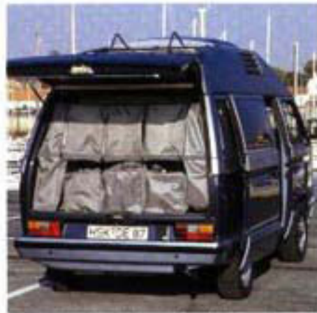
Maßgeschneiderte Kleidersäcke und Reisetaschen nutzen jeden Zentimeter Stauraum.