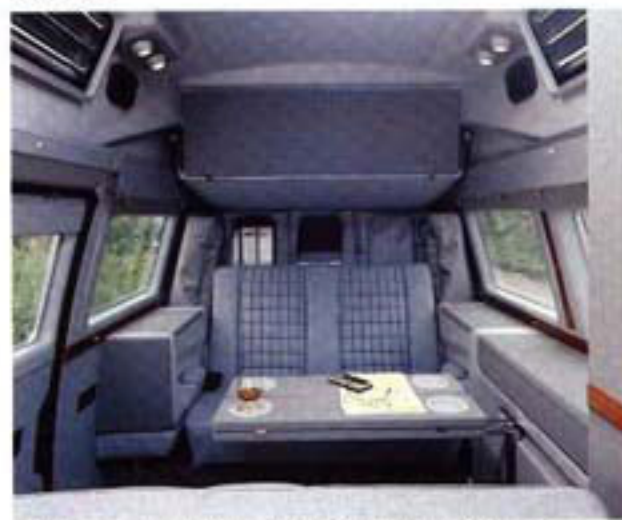
Mit einem Griff sind die Akten zur Stelle. So werden Entscheidungen gefaßt, wo es nötig ist.