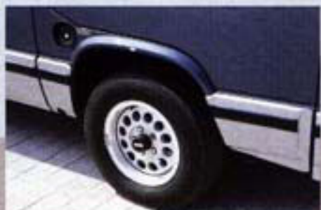
Das solide Fahrwerk wird von einer üppigen Bereifung auf form schönen Leichtmetallfelgen unterstützt.