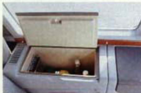
Wie Sie den PROFÍ auch nutzen – Gefühles ist immer grüßbereit.