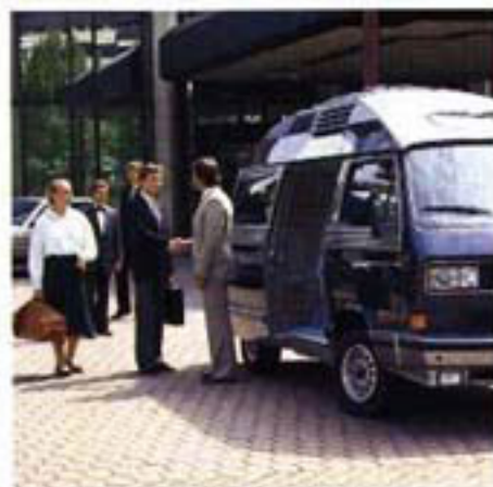
Als komfortabler Reisebus ist der PROFI unerschlagbar.